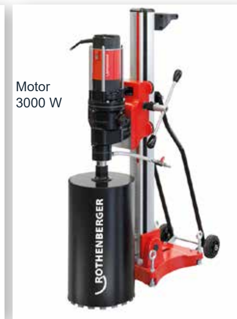
Motor 3000 W